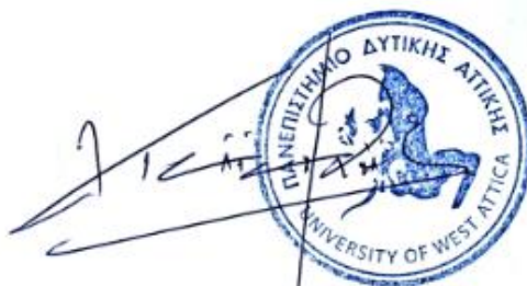
Ανδρέας Τσάτσαρης Καθηγητής